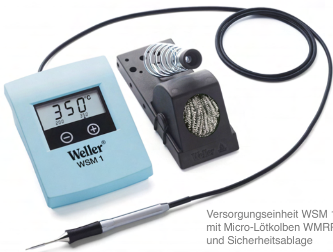
Versorgungseinheit WSM 1 mit Micro-LötKolben WMRP und Sicherheitsablage

Ideal für alle Anwender, die ein handliches und unkompliziertes Gerät benötigen, aber dennoch professionell arbeiten wollen. Dank ESD Sicherheit perfekt für den Einsatz im Labor, für Reparaturen und Service sowie in den industriellen Fertigungstechnik.